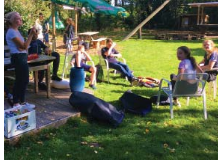
Letzte Konfi-Einladung: Kanutour 2020